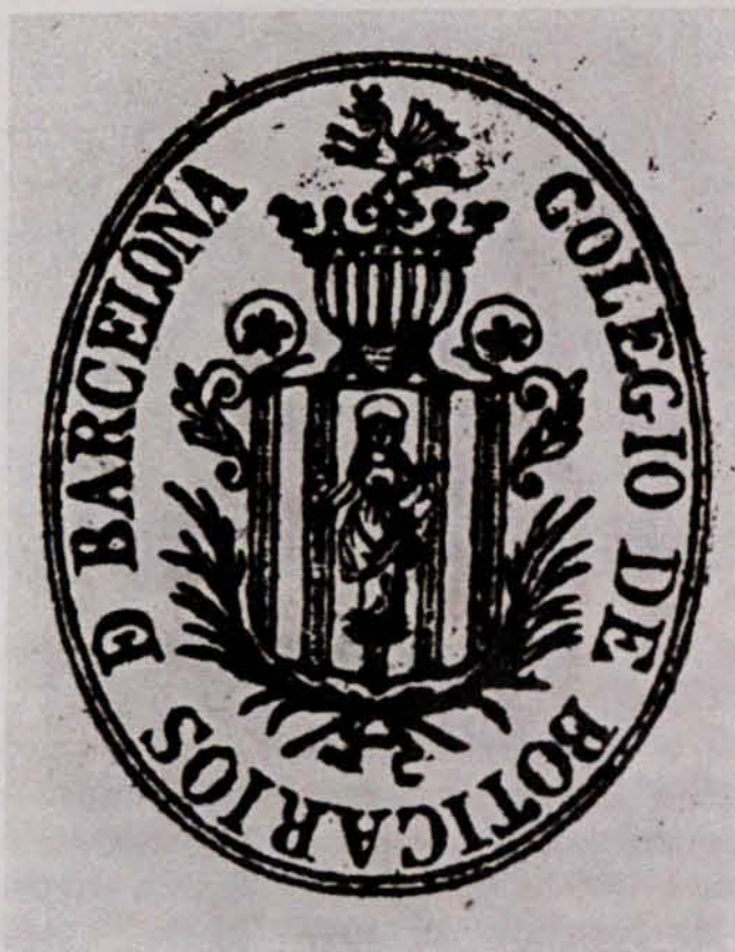
FIG. 2. — Segell del Col·legi d'Apotecaris de Barcelona. Any 1828.

sofert un descens la població de Barcelona durant la segona meitat del segle XIX corresponien aproximadament, sobre el paper, 2.000 habitants per farmàcia, densitat insuficient si hom té en compte que en el darrer quart del segle XVIII el Col·legi d'Apotecaris havia considerat que el nombre ideal d'habitants per farmàcia era de 5.200 (9). El perjudici que un excés de farmàcies podia reportar potser hauria estat