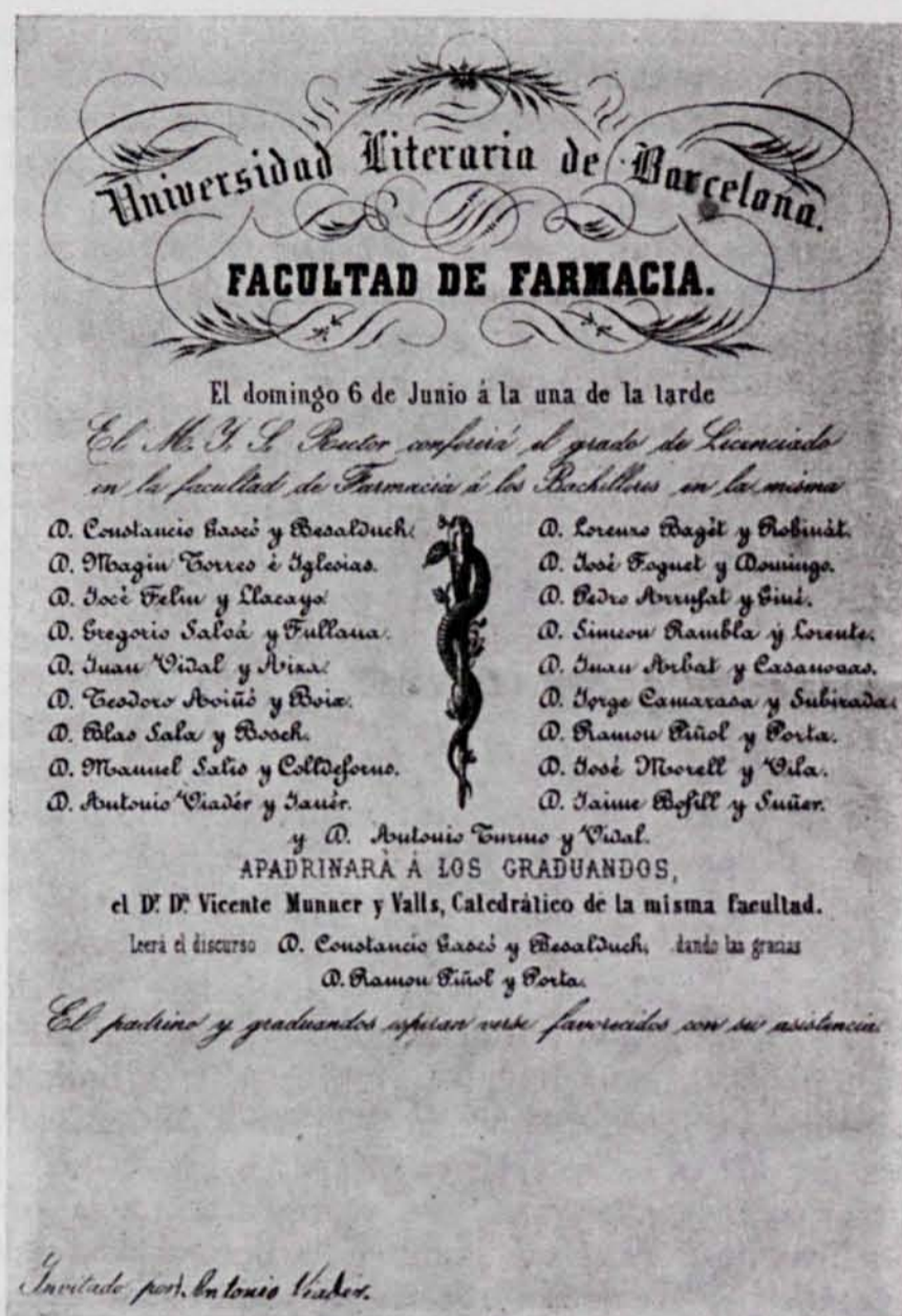
FIG. 3. — Invitació cursada pels llicenciats de la Facultat de Farmàcia de Barcelona per assistir a llur investidura.

legi es mantigué bastant actiu —sense que això signifiqui un canvi de mentalitat— fins al gener de 1847, data a partir de la qual comença una decadència collegial que es prolonga fins a l'any 1852 (16).